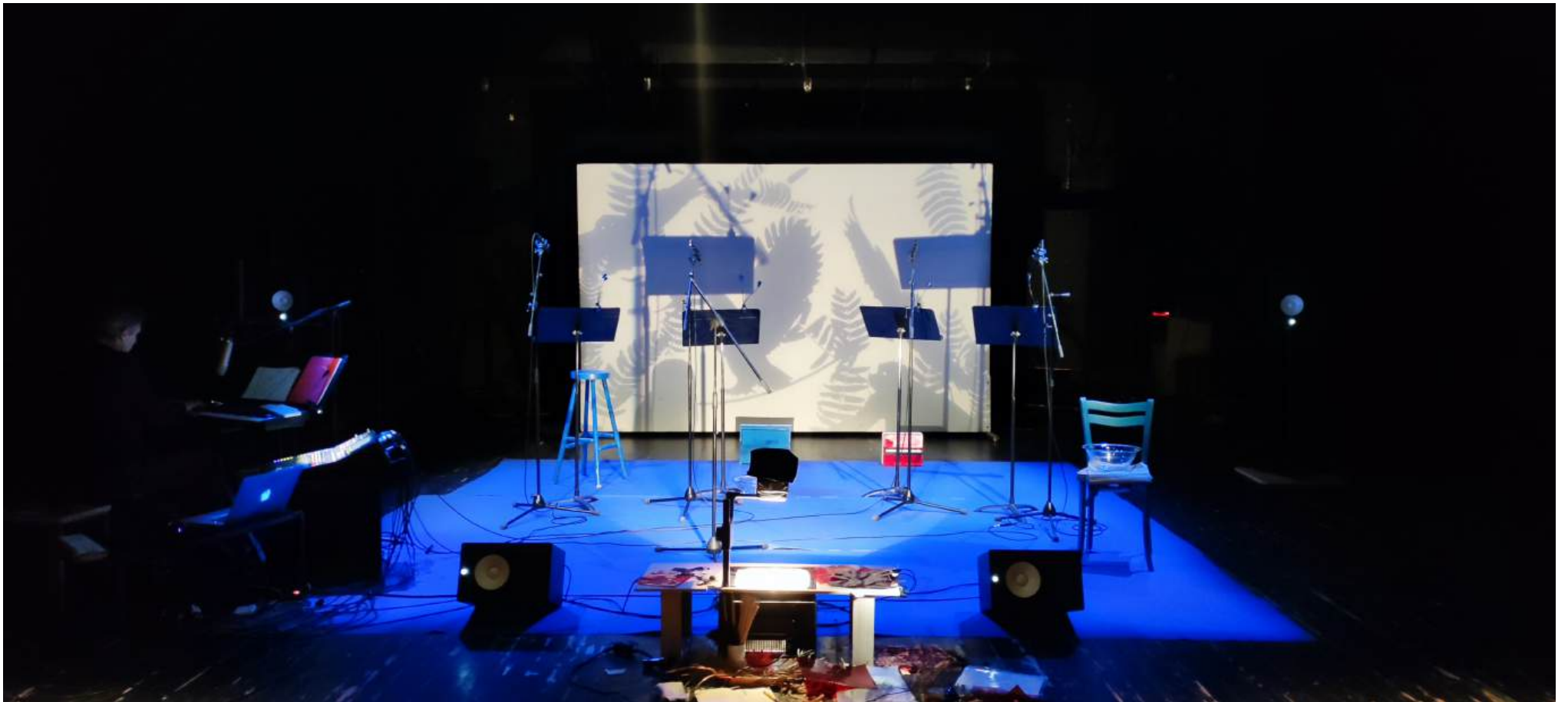
Le monde est rond – vue de l'installation / La Fonderie, novembre 2025