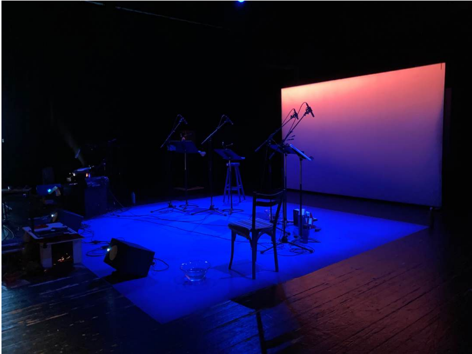
Le monde est rond – vue de l'installation / La Fonderie novembre 2025