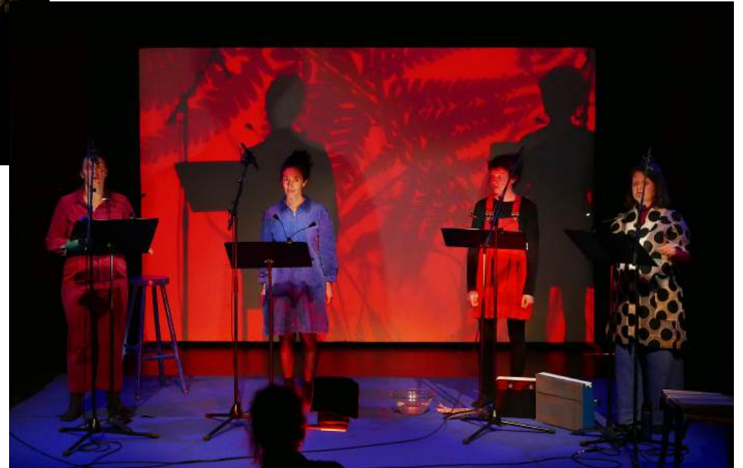
Le monde est rond – vue du dispositif en jeu / La Fonderie, novembre 2025