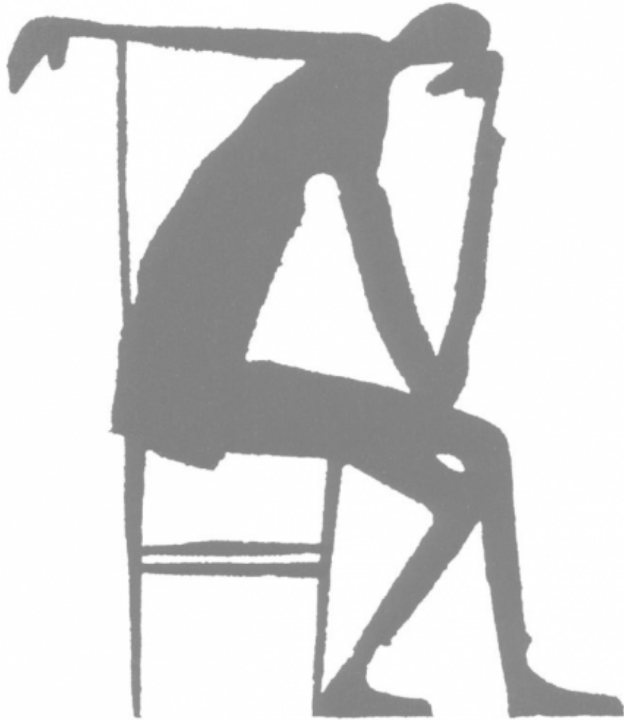
Illustration de Franz Kafka