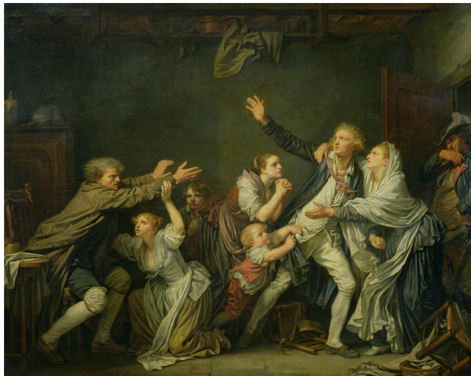
La malédiction paternelle , Jean-Baptiste Greuze, 1777