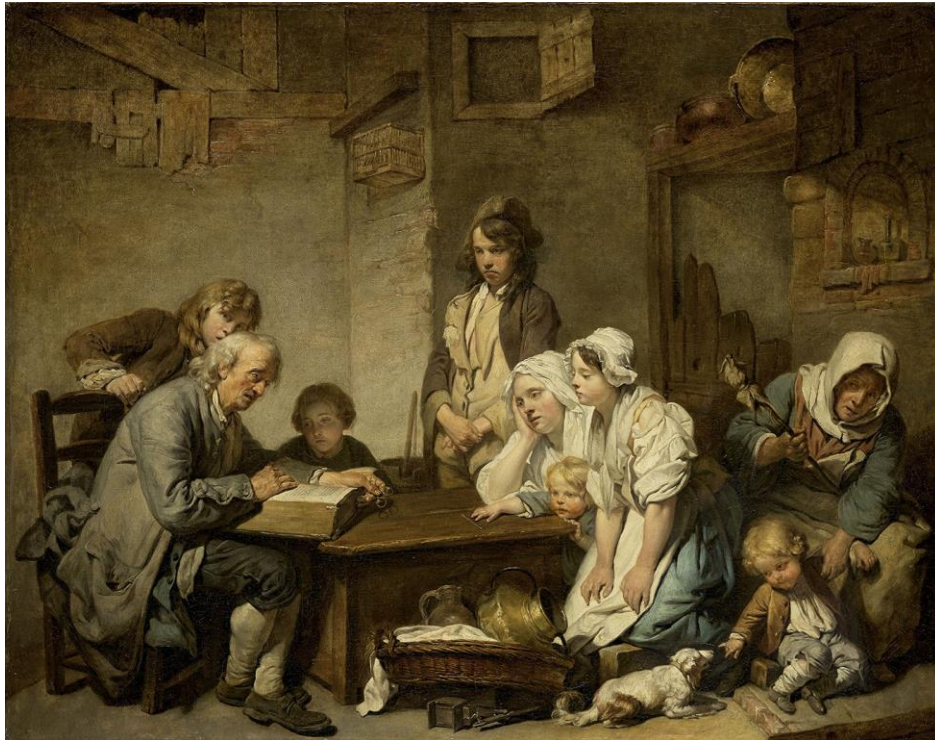
La Lecture de la bible , Jean-Baptiste Greuze, 1755