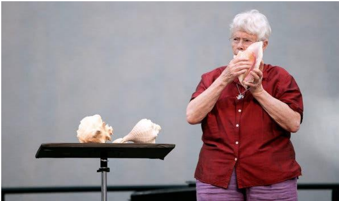
Pauline Oliveros se produisant avec le Deep Listening Band au marathon Bang on a Can