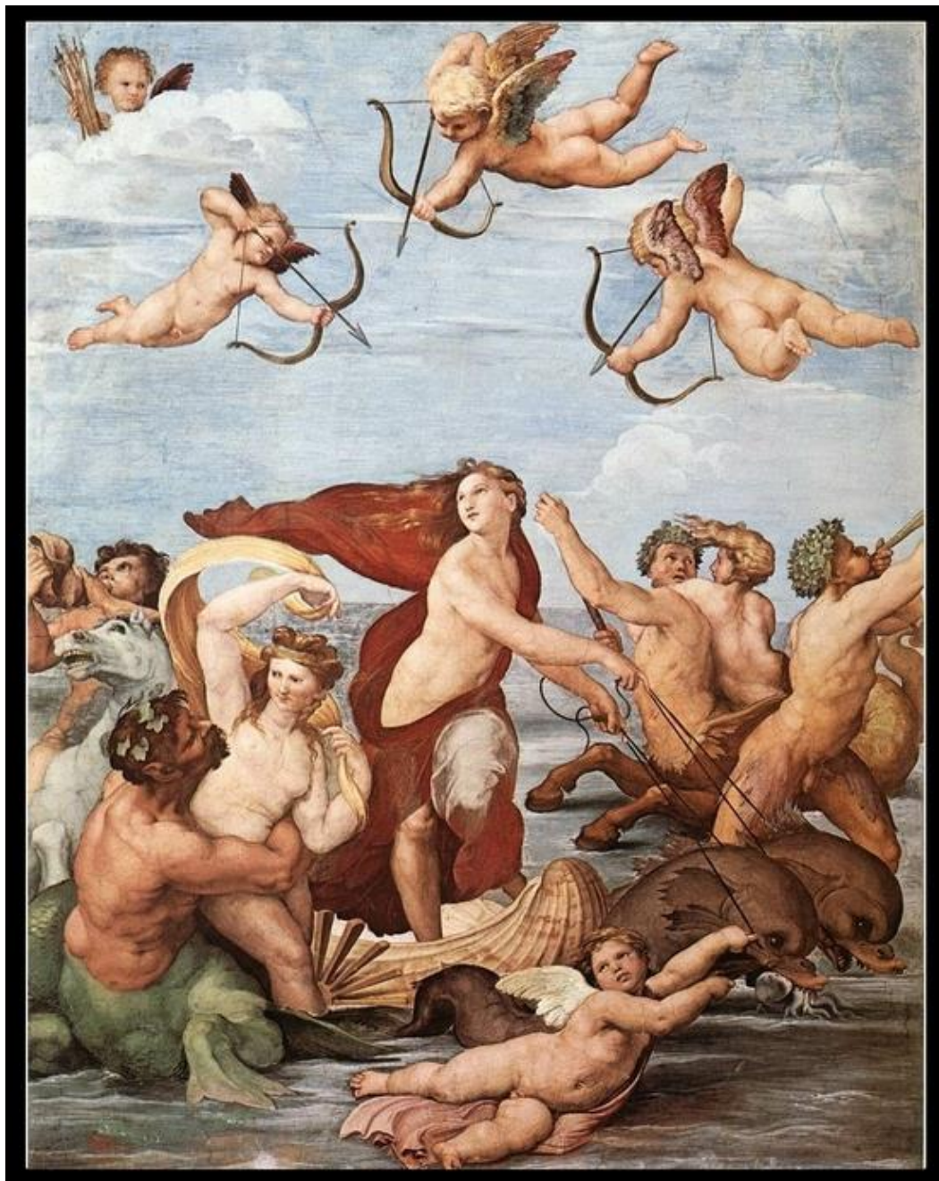
Le Triomphe de Galatée , Raphaël, fresque, Villa Farnesina, Rome, 1513