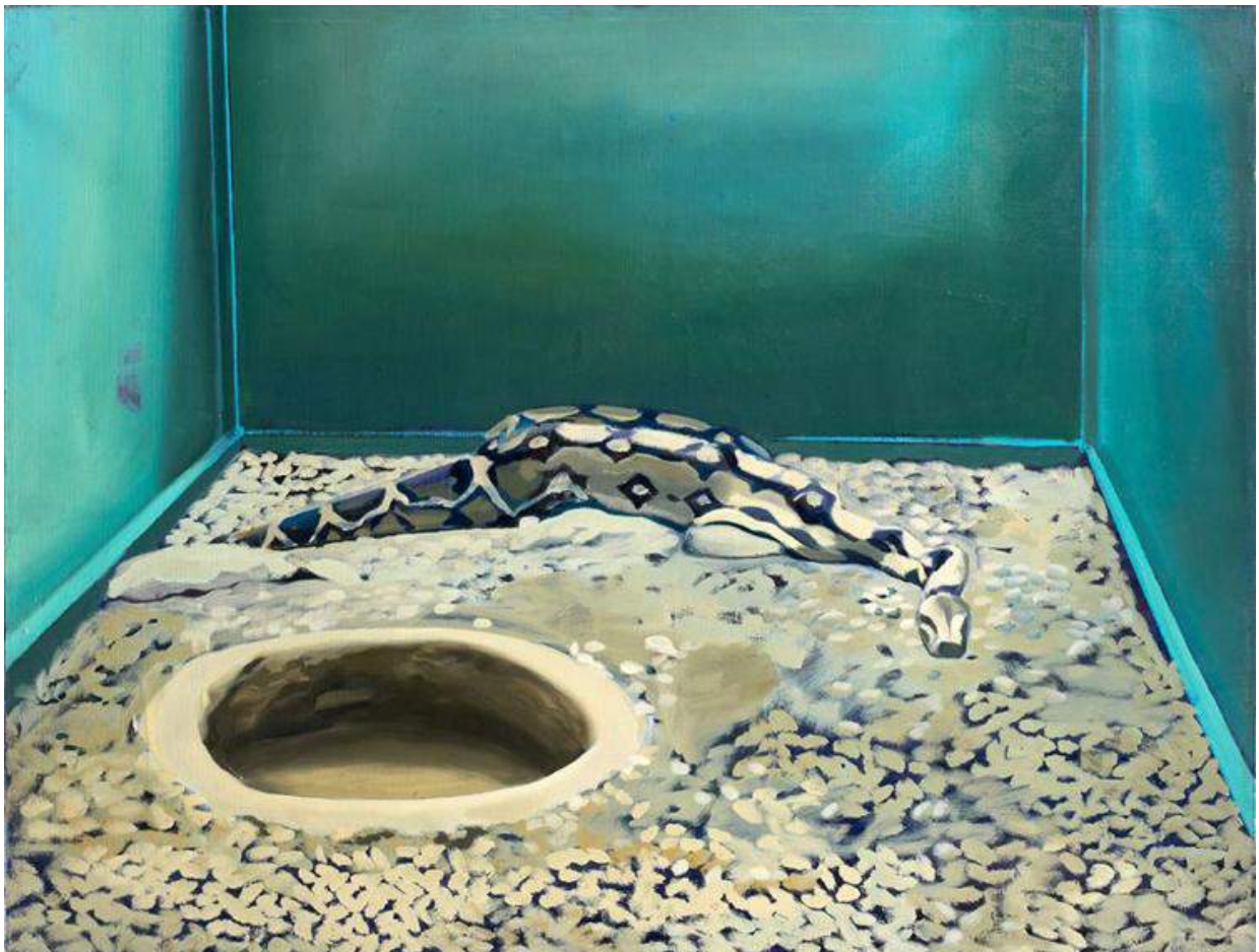
Gilles Aillaud, Serpent et trou, 1966