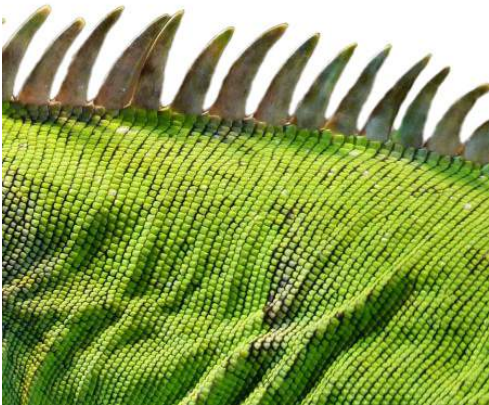
Détail, Dos d'iguane