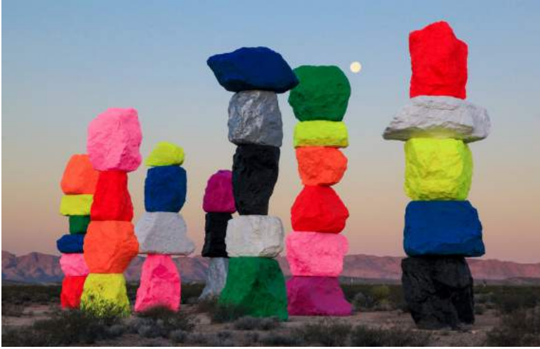
Ugo Rondinone, Seven Magic Mountains, 2016