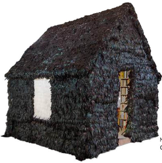
Markus Hansen, Crisis Cabin, 2011

Miquel Barcelo, La Grotte Chaumont, 2024.