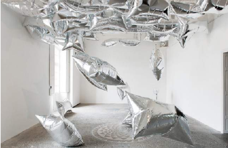
Andy Warhol, Silver Clouds, 1966