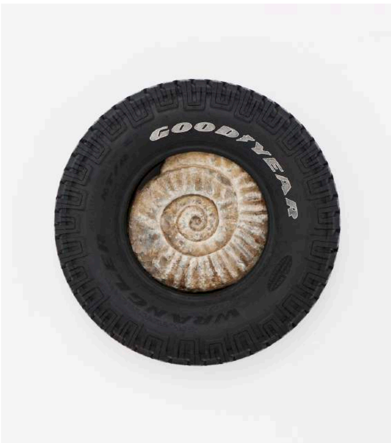
Théo Mercier, The Thrill is Gone, 2017