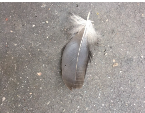
Intermède ( A line made by walking , Richard Long)